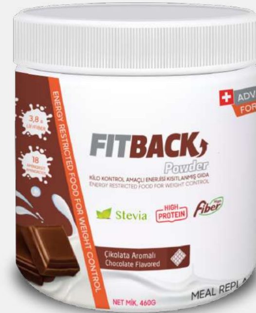
(460 Gr) Chocolate Flavored (17 Meals)