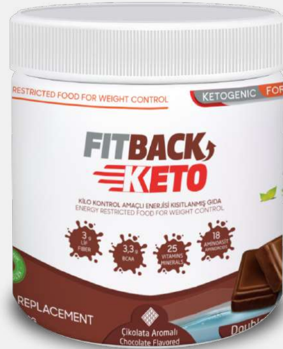
(400 Gr) 2x Chocolate Flavored (10 Meals)

FitBack Keto is a meal replacement for the ketogenic diet. For each FitBack Keto meal; About 50% of the energy you take comes from fats, 15% from carbohydrates, and 35% from proteins. With ketogenic diets in which low carbohydrate and high fat intake are made, it is aimed for the body to switch to the form of ketogenesis, where it accelerates fat burning.