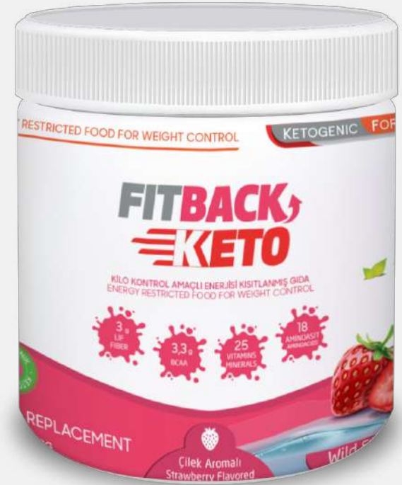
(400 Gr) Strawberry Flavored (10 Meals)