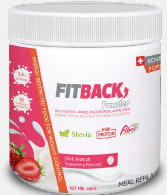
(460 Gr) Strawberry Flavored (17 Meals)